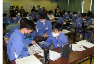
2年1組 リフレーミング