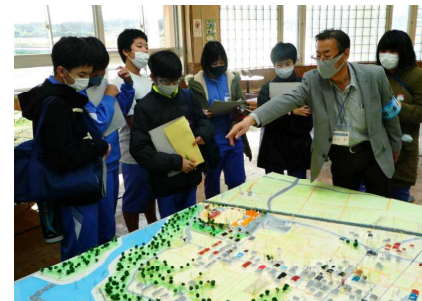
〈震災遺構中浜小学校見学〉

① 特別に支援を必要とする生徒の自立や社会参加に向けて特別支援コーディネーターを中心として生徒の特徴を的確に把握し、情報を共有し、組織的に対応する。 ② 障害法についての理解を深め、個に応じた適切な指導法を知るための研修を充実させる。 ③ 個別の指導計画に基づいて、家庭・関係諸団体との連携を図りながら必要な支援を行う。 ④ 教職員全員でインクルーシブ教育を推進するとともに合理的配慮について十分に留意する。