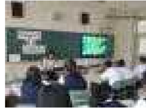
(薬物乱用防止教室)