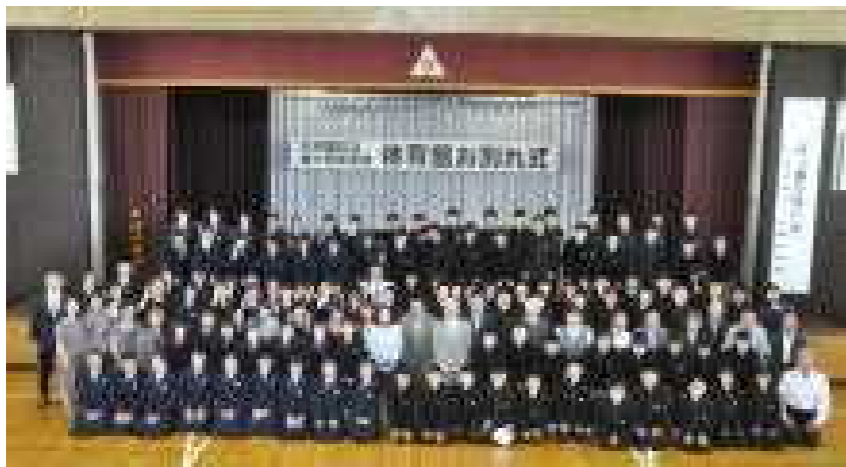
平成27年5月26日「体育館お別れ式」にて